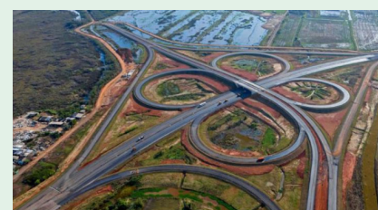
Acesso a Canoas