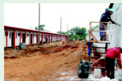
Vila de passagem para famílias