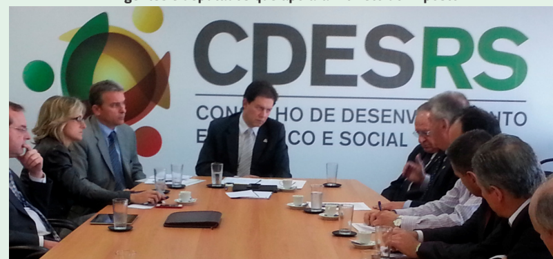
Reunião com Secretário da Fazenda