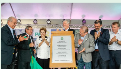
Inauguração da Rodovia

Ao longo de sua história a CICS esteve presente em inúmeros fatos marcantes na história do município. O passado da entidade sempre merece o nosso total reconhecimento, pois graças à dedicação de pessoas abnegadas em nome de uma causa maior somos, hoje reconhecidos como uma associação representativa que é ouvida e respeitada não somente na região, mas em todo o Estado e também em outros centros importantes do país.