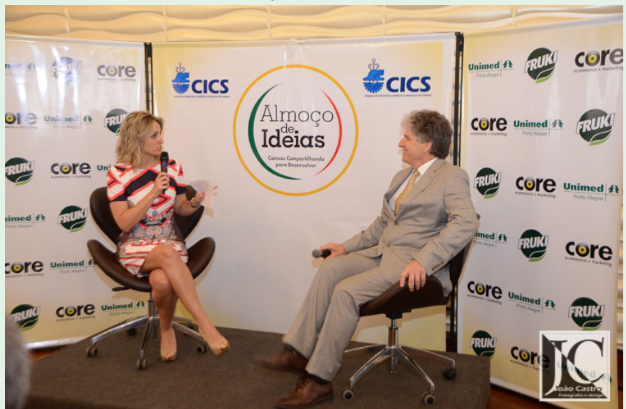
Panel de perguntas com o palestrante