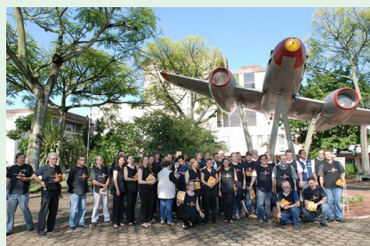
Ação de panfletagem em Canoas