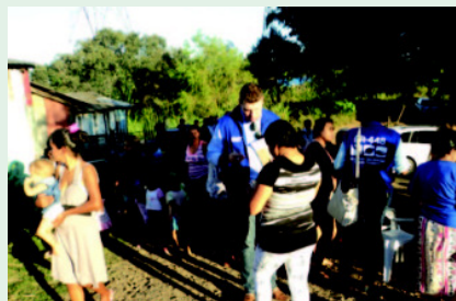
Programa de reassentamento da BR-448