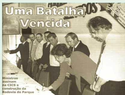
Autorização para início das obras