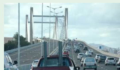
Ponte Estaiada na chegada a POA