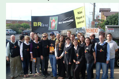
Ação de panfletagem em SL