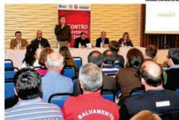
BOMBEIROS: ações propostas para evitar sinistros

Canoa - Planos de combate e prevenção de incêndio, obrigações, normas e responsabilidades foram temas abordados ontem no 1º Encontro de Prevenção de Incêndio realizado no salão nobre da Câmara de Indústria, Comércio e Serviços de Canoas (Cics), no Centro. No evento organizado pela entidade em parceria com o Corpo de Bombeiros e a Secretaria Municipal de Desenvolvimento Econômico de Canoas, empresários, militares, entidades, autoridades de órgãos públicos e representantes de associações e comunidades assistiram a palestras sobre ações e propostas para evitar e controlar sinistros. De acordo com o comandante do 8º Comando Regional do